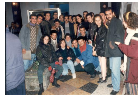
Les étudiants de Recherche Opérationnelle lors d'une activité du Laboratoire LAMOS en 1996