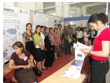
Le Stand du LAMOS au Forum Universités – Industries (Juillet 2008).

Le LaMOS a pour compétence le développement et l'application des méthodes de calcul scientifique et technique aux problèmes de modélisation, simulation et optimisation des systèmes complexes (notamment industriels et socio-économiques). Il est principalement constitué de 09 équipes et 02 groupes spécialisés :