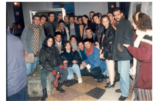
Les étudiants de Recherche Opérationnelle lors d'une activité du Laboratoire LAMOS en 1996