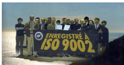
Le LAMOS a participé à la certification du port de Béjaïa