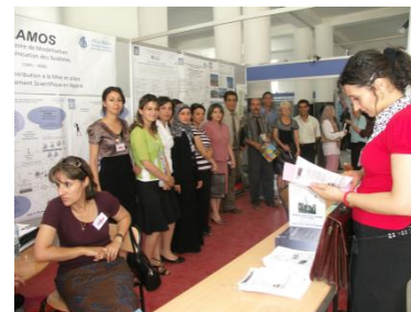
Le Stand du LAMOS au Forum Universités – Industries (Juillet 2008).

Le LaMOS a pour compétence le développement et l'application des méthodes de calcul scientifique et technique aux problèmes de modélisation, simulation et optimisation des systèmes complexes (notamment industriels et socio-économiques). Il est principalement constitué de 09 équipes et 02 groupes spécialisés :