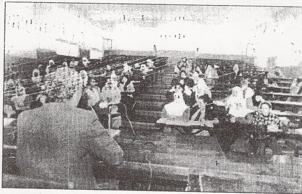
La société civile sera de la fête pour rehausser la discipline...

L'activité culturelle n'est pas en reste, puisque une pièce de théâtre pour enfants, intitulée "Leonardo Fibonacci à Béjaïa" sera réalisée avec la collaboration du TRB. Cette pièce est un témoin